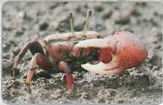
◎雄性網紋招潮蟹 蘇國強 / 攝

網紋招潮蟹擁有紅色的眼柄和螯足，背甲則如其名，有著網狀的黑白斑紋相交，而背甲寬約2至5公分左右。小型的網紋招潮蟹和雌蟹常會在洞口構築煙囪狀堆積物，這和清白招潮蟹中，僅有雄蟹建築孤塔的狀況是完全不同的。體型小的網紋招潮蟹，或是沒有大螯當作武器，因此會藉由建構煙囪來降低其他螃蟹進到自己洞裡的可能性。