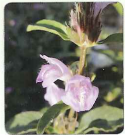
◎開著紫色小花的大安水蓼衣