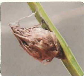
◎雲林莞草的果實

雲林莞草為多年生的禾草狀植物，其長長的地下匍莖為多年生，地上莖葉則是一年生。因此，在秋冬時節，原本在夏季綠油油一片的雲林莞草，便逐漸枯黃傾倒，露出原本泥灘地的深褐色。一直到隔年的春天，才會又抽出新芽，吐露出綠意。雲林莞草和其他灘地植物區分之處在於前者的三角狀地上莖，以及莖上小小的褐色花。