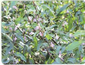
◎大安水蓼衣

在農田水圳，以及水塘池沼邊，開著紫色小花的水生植物就是臺灣特有種—大安水蓼衣了。它是於1920年首度被日本人在學術期刊上所發表的臺灣新種，屬於多年生的挺水水生植物。大安水蓼衣早期分佈於中部沿海的河口、農田水圳、田間溝渠、草澤等環境中。依照目前分佈的區域可大致分為大安、清水、龍井以及頭城四群。大安水蓼衣的生殖方式可分為無性生殖和有性生殖。目前，僅有大安和頭城的大安水蓼衣可藉由蜜蜂的傳播授粉而開花結果，清水和龍井兩地的族群僅止於開花，但卻無法結果。推測可能是因為族群太小，造成自交而無法產生得以生育的下一代所致。因此清水和龍井兩地的族群皆以無性生殖為主。因人為過度開發，道路和漁塢的興建、溝渠水泥化、周邊農耕地過度使用農藥及除草劑或任意焚燒整地等破壞環境之行為，經過調查後發現，目前大安水蓼衣野外的族群數量已低於1000株，根據國際自然及自然資源保育聯盟(IUCN)所訂立的標準，大安水蓼衣已被列於嚴重瀕絕滅之等級。