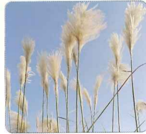
◎開卡蘆的白色絹毛隨風搖曳