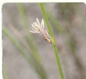
◎雲林莞草的花