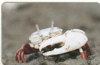
◎雄性清白招潮蟹擁有不對稱的大螯