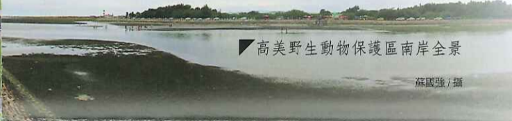
高美野生動物保護區南岸全景

高美濕地屬於亞熱帶季風型氣候區，夏季高溫多雨，主要集中在六月到八月之間；冬季則因東北季風的關係而乾旱冷冽。大甲溪的南岸，含砂量高，又臨近河口區，因此食物鏈豐富完整，為一重要的候鳥棲息區。高美濕地擁有草澤區、沙地、泥灘地、石礫堆、潮溪區、低潮區等多樣的棲地類型，使高美濕地得以孕育豐富而多樣的生物。