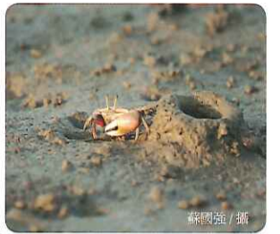
網紋招潮蟹構築的煙囪

居住在潮間帶區域的生物長期受到潮水漲退的週期影響，因而演化出許多特有的行為，譬如招潮蟹與每月大小潮汐週期同步的求偶交配行為、洞口突出物構築行為，或是與當日漲退潮汐同步的覓食行為等。