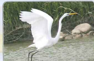
◎振翅的大白鷺，看見那黃色的嘴了嗎？

混居在小白鷺當中的大白鷺，整體外型和小白鷺近乎相似，但體型卻大的多。大白鷺的嘴巴冬季呈現黃色，夏季則為黑色，而不同於小白鷺鮮豔的黃綠色腳趾，大白鷺的腳和腳趾皆呈深黑色。屬於冬候鳥的牠，亦普遍見於臺灣本島，常可在河口、潮間帶、沼澤、沙洲和湖泊等地見其蹤跡。大白鷺的覓食方式和小白鷺相同，常會以腳擾動水面，趁機捕食那些被驚得四處逃竄的魚、蝦或蟹類。