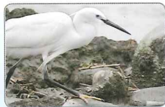
◎黑色的嘴和腳，但腳趾卻是顯眼的黃色

臺灣人口中常常說起的白翎鷺(台語)就是小白鷺。黑色的嘴巴和腳，配上亮眼黃綠色的腳趾，又披著一身雪白的羽毛，經常優美飛翔於高美出海口附近的池，是臺灣非常常見的留鳥。小白鷺經常以腳打探水中的魚蝦蟹類，伺機覓食。而繁殖期則高密度的在木麻黃、竹林或相思樹林中築巢。常可於整片樹林中看見雪白棉絮似的小白鷺們點綴於綠蔭中，嘎嘎聲不絕於耳。