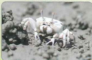
◎雌性清白招潮蟹

當你望向泥灘地看見一顆顆的小白點時，十之八九為清白招潮蟹。整身背甲乃至螯足為乳白色，而腹面則依著季節或所處的潮區不同，呈現紅色或黃色。其體型並不大，背甲寬約1至2公分，普遍出現在全臺灣的潮間帶。雄性清白招潮蟹會隨著潮水週期在洞口用土堆起半月型的突出物，其功能目前尚不清楚，但可能和吸引雌蟹有關。