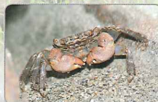
◎神妙擬相手蟹

在高美濕地石礫堆最大宗的螃蟹族群為神妙擬相手蟹。背甲寬約兩公分寬，上有雲斑狀的花紋，螯足呈現紅棕色。神妙擬相手蟹多藏匿於石頭間的縫隙當中，其最大的特徵是位在第一和第二步足間，以及第二和第三步足間的毛囊。雜食性的神妙擬相手蟹，經常取食任何食物碎屑、植物碎屑、其他動物屍體等為生。