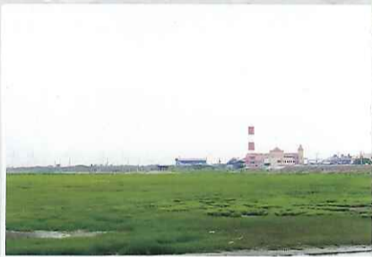
吳自強 / 攝