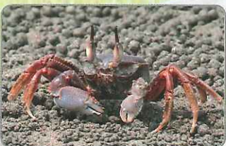
◎角眼沙蟹眼柄上端的突起為其特色

同樣居於沙地的角眼沙蟹，成體體型通常較痕掌沙蟹大，且眼睛上端有著細長的突起。角眼沙蟹體色為黃褐色，在沙地移動時不易被查覺。其屬肉食性螃蟹，在橢圓斜口的洞口處，偶爾能夠看到食用過的食物殘渣，包括其他蟹類的空殼、小魚殘骸等。洞口同樣是散落著土塊，但是土塊通常是以放射狀方式四散於洞口外。