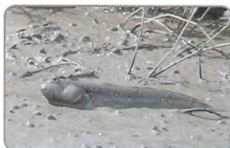
◎看到大彈塗身上美麗的寶藍色斑點了嗎？