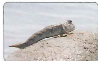
◎跳彈塗跳上露出水面的石頭，喘口氣