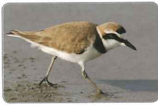
◎正在灘地上覓食的東方環頸鸕

體型嬌小的東方環頸鸕，是臺灣非常普遍的冬候鳥。頭頂著紅褐羽色的牠，全身大抵為白色，有條由嘴喙基部延伸至眼睛的黑色橫帶。10月至隔年4月為能夠在潮間帶和河口等地觀賞東方環頸鸕的絕佳時機。牠們較偏好鹹水水域，經常在潮間帶的灘地上覓食，並以小碎步前進。但因警戒性極高，因此常讓我們只能藉由望遠鏡觀賞牠們的可愛之姿。