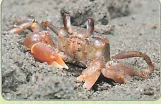
◎尚未受到驚嚇的痕掌沙蟹，體色呈紅褐色

沙地上快速移動的紅點，即為又稱幽靈蟹的痕掌沙蟹。顧名思義，痕掌沙蟹近乎等大的大螯內側，橫著一個直線刻痕。牠們移動的速度飛快，而火紅的體色，在受到驚擾之後，會立刻轉變為和沙地類似的黃褐隱蔽色。中等體型的痕掌沙蟹，洞口形狀為橢圓形斜口，洞外距洞口不遠處，則散落著數個土塊。