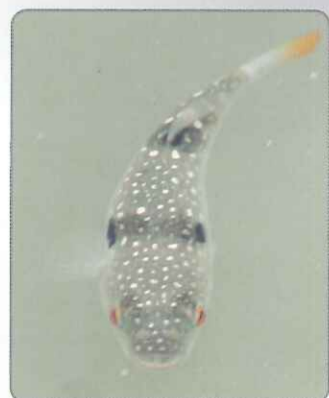
◎星點東方魮身上分明的白點