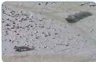
◎跳彈塗與身後的大彈塗，體型有明顯差異

大彈塗體長為彈塗魚當中最大者，約10至15公分左右，體表顏色接近泥灘地的褐色。和跳彈塗不同的是，大彈塗的身上覆有許多寶藍色的斑點，背鰭上的寶藍色斑點更多，在背鰭展開的時候更為明顯。大彈塗同樣有著肉質化的胸鰭和吸盤狀的腹鰭，但牠的行動力卻不如跳彈塗，僅能用胸鰭和腹鰭撐起身體，然後再用胸鰭靠划船似的划槳方式向前行進。