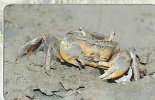
◎黃綠體色的臺灣厚蟹

體色為黃綠色的臺灣厚蟹，是肉食性螃蟹。偶爾能見到牠飛奔向其他無防備的招潮蟹(例清白招潮蟹、網紋招潮蟹等)，以有力的雙螯鉗住對方、將獵物背甲夾破之後進食。但因為這樣主動出擊的方式太耗費能量，因此比較常看到牠取食屍體(螃蟹、彈塗魚等)或是植物碎屑等。