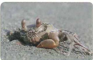
◎警覺性高的痕掌沙蟹在洞口觀察著