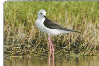
◎像似踩著高蹺的高蹺鸕

身雪白羽色，對比上頭頂和後頸處的黯黑，以及一雙細長粉紅色的長腿，是高蹺鸕的正字標記，其中文名也是因為那細長的雙腿而依其命名。體型中型的高蹺鸕，也是臺灣常見的冬候鳥，可在8月至隔年4月左右，陸續在沿岸沼澤、濕地、水田等地見其蹤跡。牠們黑色細長的嘴喙，可戳入泥灘地中翻攪覓食，有時也會在水面上啄取或是用左右掃掠水面的方式取食水中的魚蝦蟹類。