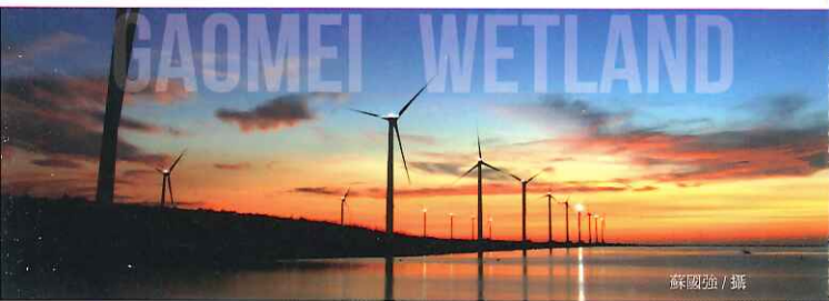
晚霞相伴的高美野生動物保護區

高美濕地在民國九十三年(2004年)九月二十九日依據野生動物保育法第10條規定由臺中縣政府公告劃定為「高美野生動物保護區」，其目的在保護當地野生動植物及其棲息環境，公告在保護區內不得獵捕、採集野生動植物。然高美濕地因傳統農漁業利用及民眾遊憩行為管理不易，造成濕地生態環境遭受破壞，雲林莞草族群數量日益縮減。尤其假日，數以千計的遊客恣意踐踏灘地、挖掘螃蟹等行為，皆威脅到濕地內生物之生命。