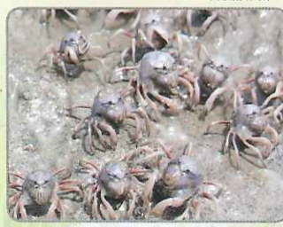
◎集體出動覓食的和尚蟹

外表渾圓的短趾和尚蟹，頭胸部呈現淡藍色，對比上步足基部的嫣紅，外型相當討喜。和尚蟹又俗稱「行軍蟹」，因為在退潮時，成千上萬的和尚蟹聚集在沙泥地中，密密麻麻的往同一個方向一邊進食一邊前進，就像一支在行軍的軍隊一般。此外，和尚蟹前進的方式和一般螃蟹橫行前進的方式不同，是以直行方式向前。當和尚蟹遇威脅時，會以旋轉的方式旋入灘地中躲藏，待安全後才會再探出頭前進。