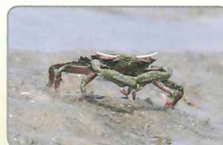
◎在泥灘地上覓食的短身大眼蟹

背甲呈現長方形的短身大眼蟹，常隱身在有薄薄水層的泥沙混合地中。大眼蟹並無明顯大小螯區分，而其特徵為，在褐色大螯上，有著許多黃色顆粒凸起，如狼牙棒一般。大眼蟹的洞口屬於扁平狀，但在淺薄的水層下，不太容易觀察。不過，在烈日當頭時，卻常能看到牠們伸展全身的肢節，直挺挺的站立在灘地上，享受陽光的曝曬。這個行為的用意目前仍不甚清楚，但是看到螃蟹也會享受日光浴的情景，不禁令人會心一笑。