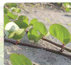
◎葉型如其名的馬鞍藤

馬鞍藤是臺灣海岸沙地相當常見的一種濱海植物，它的葉片為馬鞍型，且開著紫紅色的喇叭型花朵。因為是屬於藤蔓類的濱海植物，並且耐旱抗鹽，因此也有固沙的作用。厚實的葉片、少量的氣孔數和蠟質葉面，讓它得以在烈日下減少水分的散失。而馬鞍狀的葉片，則能夠左右彎折成適當角度，在日正當中的時候避免陽光直射。以上特性讓馬鞍藤能夠在海岸沙地這種惡劣的環境下生存，並且拓展成為濱海的優勢植物物種。